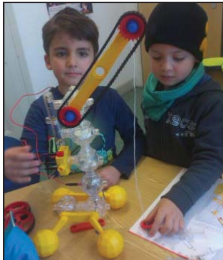
Die Elektronik-Werkstatt ist eine angesagte AG der OGS.

die Möglichkeit, elektronische Fahrzeuge zu bauen. So wurden bereits ferngesteuerte Autos, ein Baukran oder eine Spinne, die eine Wand herauf und herunter klettert, selbständig gebaut.